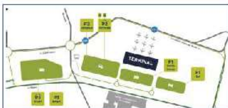
Bergamo Orio al Serio